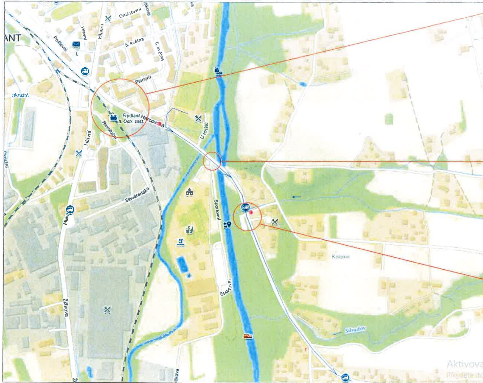
Závodníci vyjedou ve Frýdlantu nad Ostravicí z hřiště a budou pokračovat po ul. Harcovské dále ...