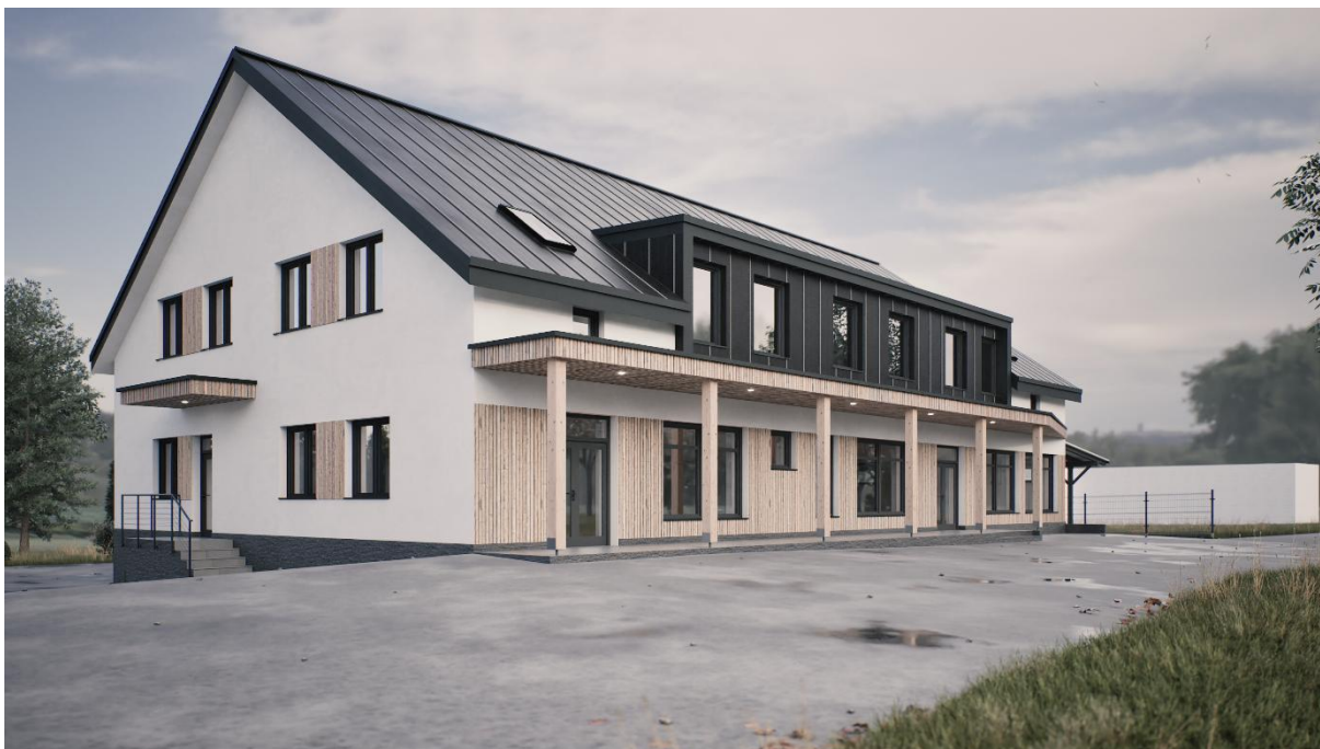
Vizualizace přestavby budovy bývalé Jednoty, autor návrhu: Ing. Štěpán Šnupárek

Vzhledem k obecnému stárnutí populace lze předpokládat nárůst potřeb v této oblasti. Obec proto bude nadále spolupracovat s institucemi v ORP (Frýdlant nad Ostravicí), případně dalšími. Klíčovým je v tomto ohledu záměr přestavby budovy bývalé jednoty na objekt občanské vybavenosti, který bude integrovat malometrážní bezbariérové byty pro seniory, případně byty startovací, s dalšími zdravotně-sociálními službami.