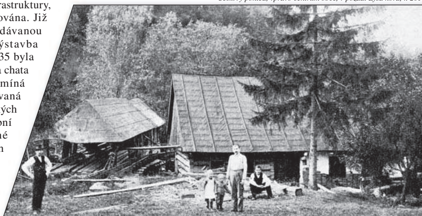
Vodní pila č. p. 53 v údolí Satiny, kolem r. 1915