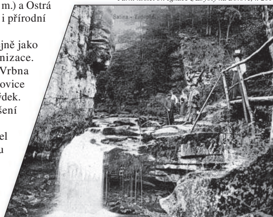
Satinský vodopád, kolem r. 1910