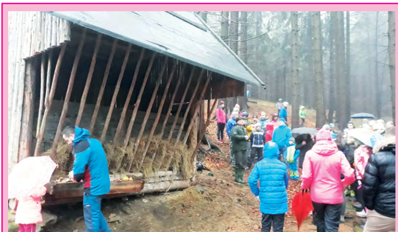
Na 21. ročník tradičního krmení zvířátek dorazilo i přes nepřízeň počasí 81 účastníků a 6 psů.