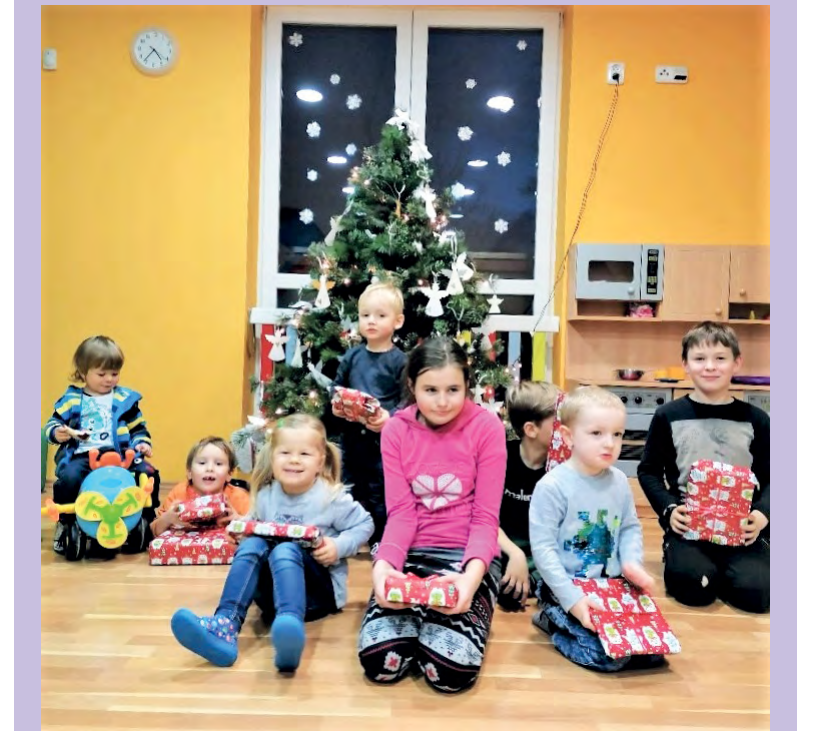
Ježíšek naděloval i pod stromčkem v naší rosnickovské herně...