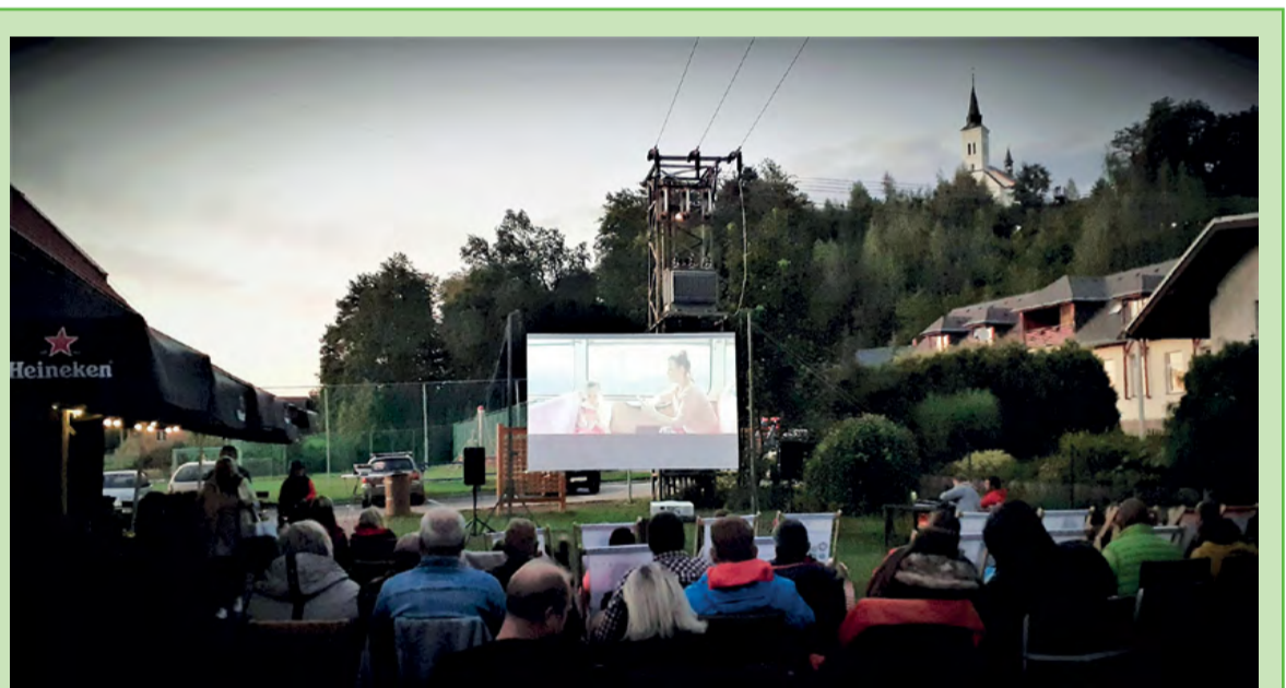
Mimořádná událost – Vlaková souprava bez strojvedoucího projela letním kinem u Obecního domu v pátek 2. září.

• Festival ochotnického divadla Figa Borová se uskuteční o víkendu 4.–6. listopadu v hospodě Pod Borovou . Těšit se můžete na autorskou detektivní komedii „ Vraždy v hotelu Pine Hill Inn “ v podání Ochotnického spolku malenovického, komedii G. Sibleyrase a P. Haudecoeuera „ Pozor natáčíme! “ sehraje metylovický Sokol na prknech a do třetice vystoupí Divadlo Šmíry s autorskou fraškou „ Hurá, přijede strýček “. Bližší informace o programu, předprodeji, permanentkách apod. najdete na www.spolekosc.cz , facebooku a plakátech.