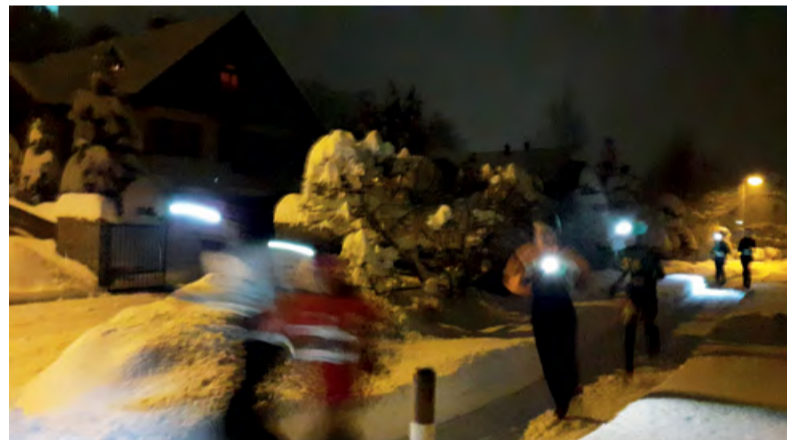
VÁNOČNÍ běh Malenovicemi měl tentokrát díky opravdu zimnímu počasí neřalšovanou předvánoční atmosféru.

Příští 7. ročník je opět naplánovaný na poslední předvánoční pátek a my se na všechny budeme těšit. Za organizační tým přejeme po klidném prožití vánočních svátků vyběhnout pravou nohou do roku 2023.