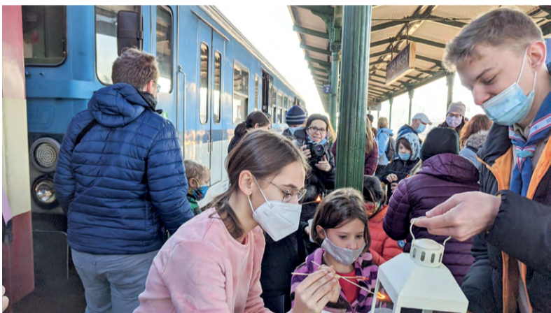
Betlémské světlo přinesli do malenovických domácností malí turisté z TOM Lysáci.