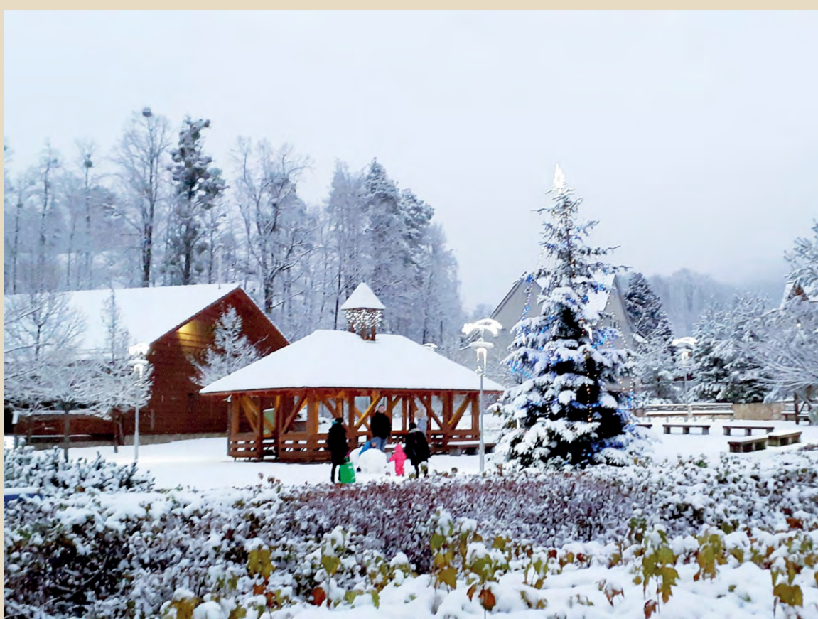
Předvánoční náves pod Borovou.