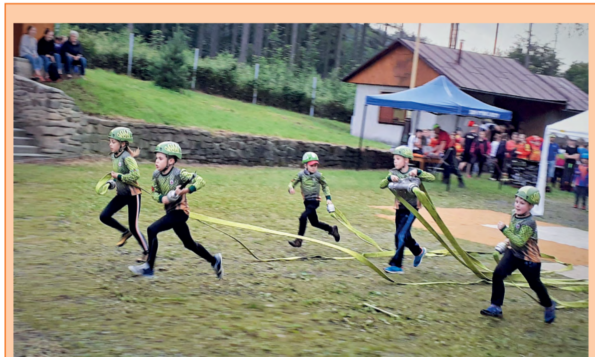
Přestože soutěžní sezóna začala letos se značným zpožděním, podařilo se mladým hasičům z Malenovic dosáhnout hned několika medailových umístění. Na snímku útok družstva Mladší B na soutěži ve Vyšních Lhotách.